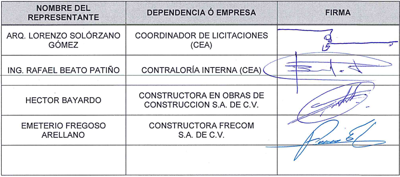
HOJA DE FIRMAS CORRESPONDIENTE AL ACTA DE JUNTA DE ACLARACIONES DEL CONCURSO POR INVITACIÓN No. CEA-RP-CI-101-2015